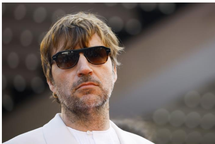
Albert Serra Juanola (Bañolas, Gerona, 9 de octubre de 1975) se licenció en Filología Hispánica y Teoría de la Literatura por la

Universidad de Barcelona. Su primer largometraje fue Crespìà, the film not the village , realizado en 2003, el cuál no llegó a estrenarse comercialmente. La película que inició su filmografía, y la que significó la primera obra de su productora Andergraun Films, fue Honor de cavalleria , estrenada en 2006. Esta segunda película, la cual se presentó en la Quincena de Realizadores del Festival Internacional de Cine de Cannes de 2006, fue seleccionada como una de las diez mejores películas del año 2007 por la revista Cahiers du Cinéma . En el camino de asentarse como director de autor y prestigio, en 2008 dirigió El cant dels ocells , película que muestra una nueva perspectiva del mito de los reyes magos.