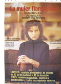
La mujer flambeada Robert Van Ackeren, 1983

"Si desea enviar un mensaje, pruebe Western Union"