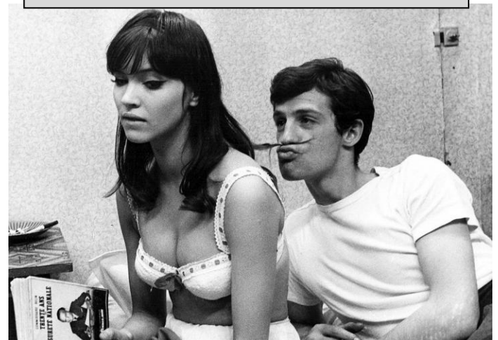
Jean-Paul Belmondo y Anna Karina