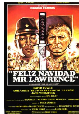
Feliz Navidad, Mr. Lawrence Nagisa Oshima, 1983

"Cuando alguien me pregunta a cuál escuela de cine he ido, yo respondo: -No fui a ninguna escuela de cine, solo fui al cine-".