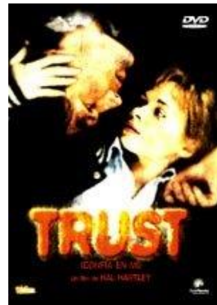
Trust (Confía en mí) (Trust, 1989) Hal Hartley