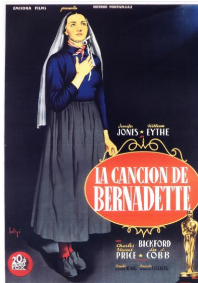
La canción de Bernadette ( The song of Bernadette , 1933) Henry King

1958 martxoa 21 marzo 1958 sesión 156 emanaldia