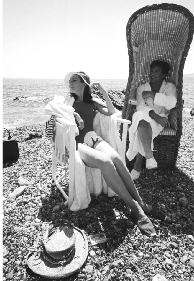
Albert Finney and Audrey Hepburn relajándose en la playa durante el rodaje de Dos en la carretera (1967), de Stanley Donen