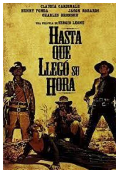
Hasta que llegó su hora (C'era una volta il west, 1968) Sergio Leone