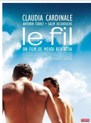
LE FIL (2009) Mehdi Ben Attia