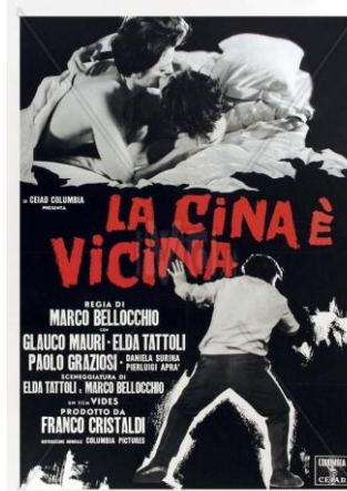
China está cerca ( La Cina è vicina , 1967) Marco Bellocchio

1973 urtarrila 8 enero 1973 sesión 809 emanaldia