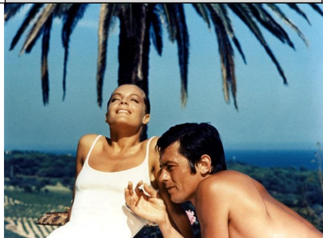
La piscina (1969), de Jacques Deray