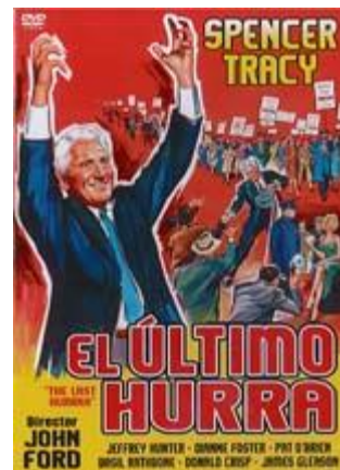
El último hurra ( The last hurrah , 1958) John Ford

1973 urria 8 octubre 1973 sesión 834 emanaldia