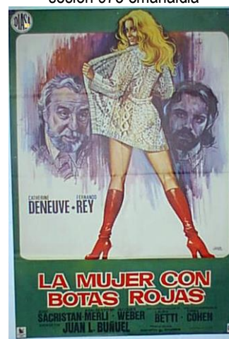
La mujer con las botas rojas (1974) Juan Luis Buñuel

1977 urria 10 octubre 1977 sesión 973 emanaldia