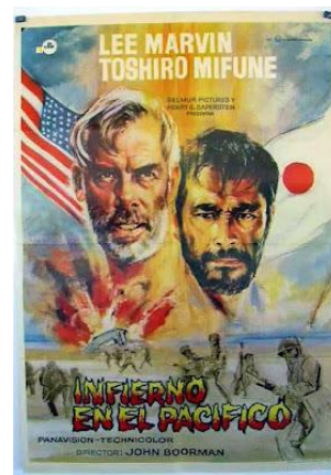
Infierno en el Pacífico ( Hell in the Pacific , 1968) John Boorman