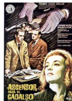
Ascensor para el cadalso ( Ascenseur pour l'échafaud , 1958) Louis Malle

1970 martxoa 9 marzo 1970 sesión 690 emanaldia