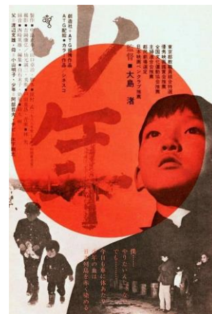
El muchacho (Shōnen, 1969) Nagisa Oshima

1973 apirila 24 abril 1973 sesión 823 emanaldia