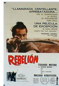
Rebelión (Jô-uchi: Hairyô tsuma shimatsu, 1967) Masaki Kobayashi