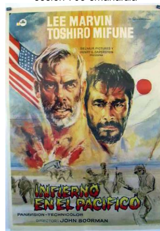
Infierno en el Pacífico (1971) John Boorman

1971 azaroa 29 noviembre 1971 sesión 768 emanaldia