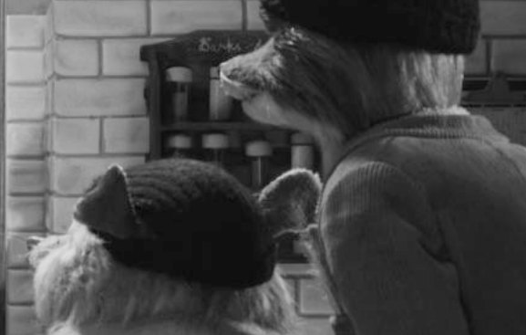
19.45 h. · 10.05.2011 · SESIÓN 2063 EMANALDIA