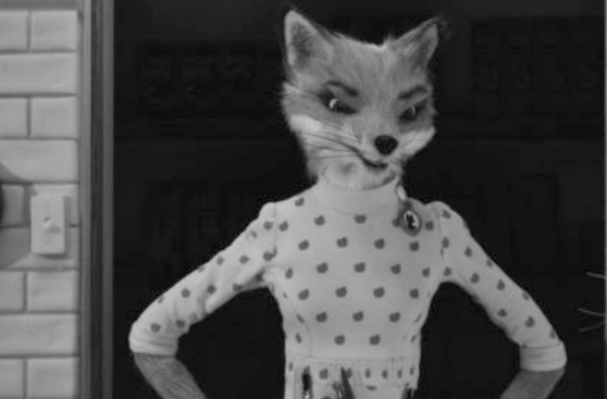
FANTASTIC MR. FOX V.O.S.E.