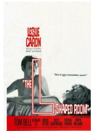
La habitación en forma de L (The L shaped room, 1962) Bryan Forbes

1972 martxoa 20 marzo 1972 sesión 783 emanaldia