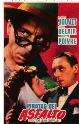
Piratas del asfalto (Copie conforme, 1948) Jean Dreville

1958 ekaina 9 junio 1958 sesión 167 emanaldia